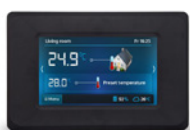
Panel pokojowy dotykowy Ester X80 bezprzewodowy