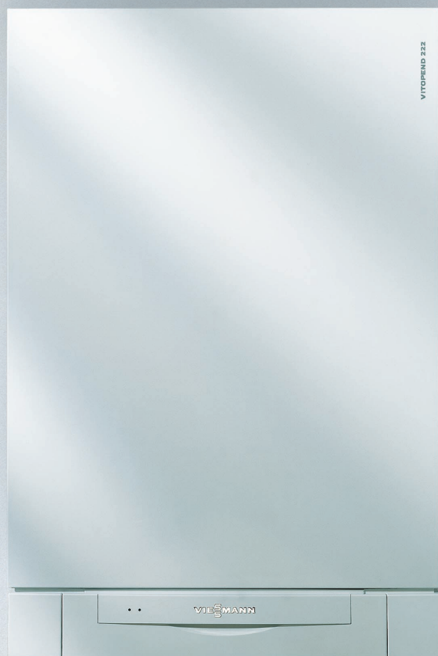
Vitopend 222 – wieszący kocioł gazowy zapewnia- jący wysoki komfort ogrzewania i korzy- stania z ciepłej wody użytkowej