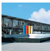
Centrum Viessmann w Allendorf z firmowym muzeum „Via Temporis”