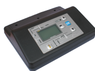
Zalecane sterowanie RecalArt Optima Eco

Kocioł standardowo wyposażony jest w miarkownik ciągu. Przy spalaniu paliw gorszej jakości zalecane jest zamontowanie nadmuchu w kotłach mocy 23-56 kW (wersje 4 - 8)