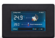
Panel pokojowy dotykowy Ester X80 bezprzewodowy