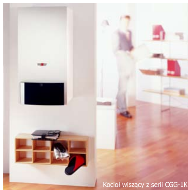
Kocioł wiszący z serii CGG-1K

Kotły serii CGG-1K przeznaczone są do zasilania gazem ziemnym GZ 50, GZ 41,5 oraz gazem płynnym.