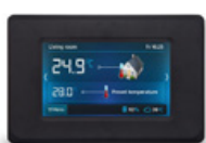
Panel pokojowy dotykowy Ester X80 bezprzewodowy