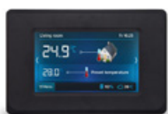
Panel pokojowy dotykowy Ester X80 bezprzewodowy