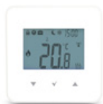
Panel pokojowy Ester X40 bezprzewodowy